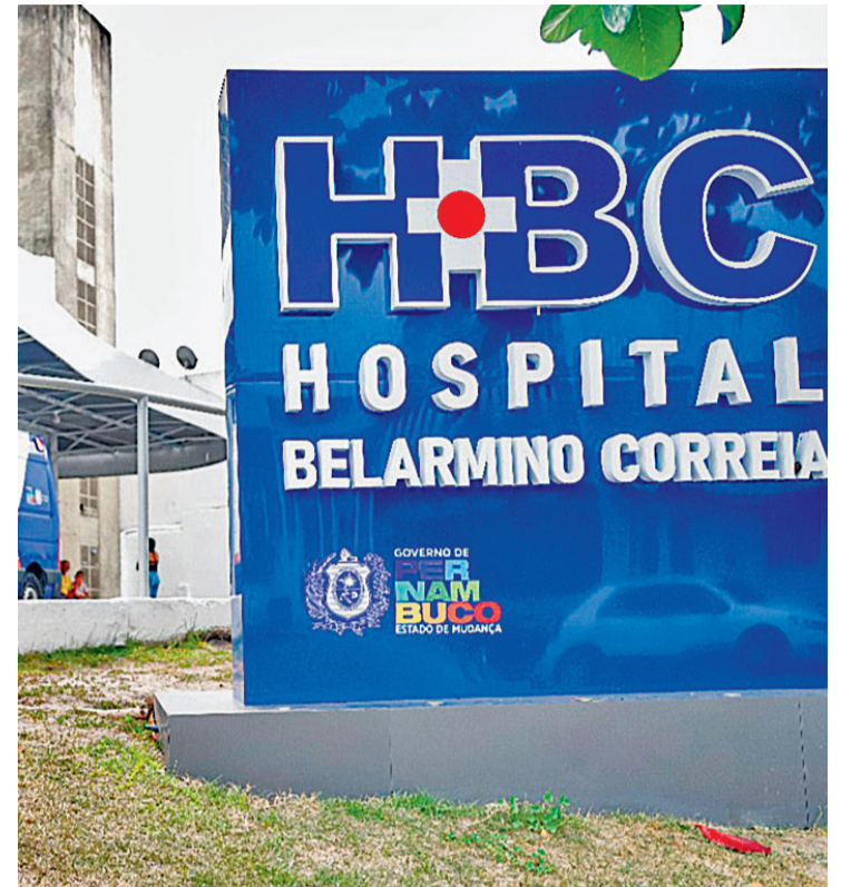
O Hospital Belarmino Correia, em Goiana, está na lista

A gestão destaca ainda que a manutenção correta desses equipamentos públicos resulta na redução de custos por meio das ações preventivas, proporcionando aumento de vida útil das instalações.