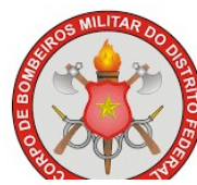
CORPO DE BOMBEIROS MILITAR DO DF