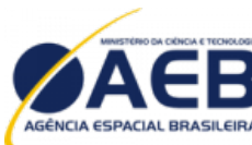
MINISTÉRIO DA CIÊNCIA E TECNOLOGIA