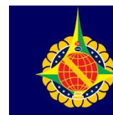
POLÍCIA MILITAR DO DF