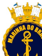
MARINHA DO BRASIL