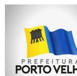
PREFEITURA DE PORTO VELHO