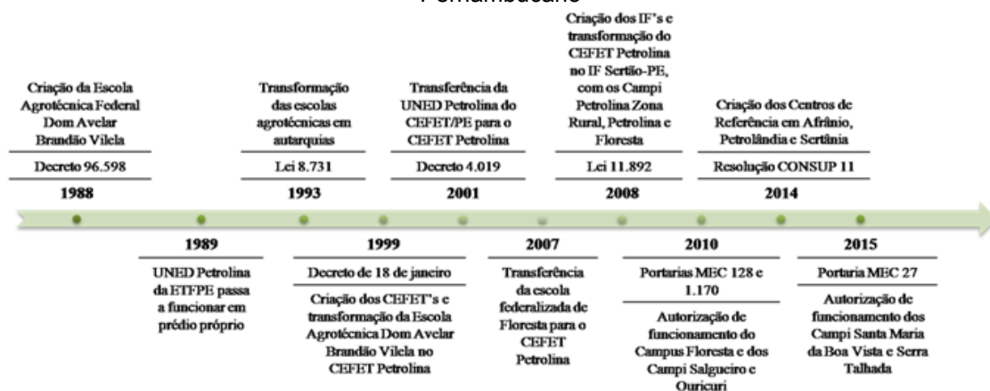
Figura 1. Cronologia da Rede Federal de Educação Profissional e Tecnológica do Sertão Pernambucano